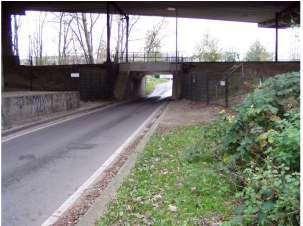
Nu alleen de Barakkenbrug nog over en de Boezemlaan.